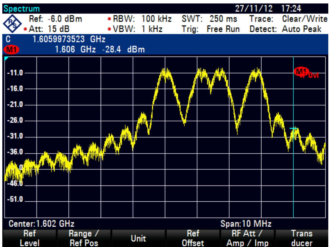
Obrázek 2: Spektrum signálu GALILEIO E1